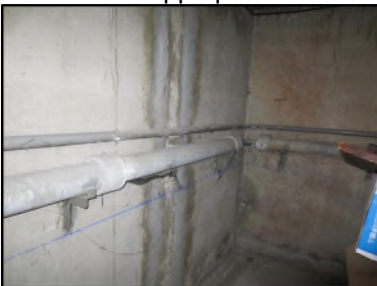
Photo N° 640 AMIANTE CIMENT - CAVE 5_S.sol Conduits de fluide Chute E.U.(Fibres-ciment)