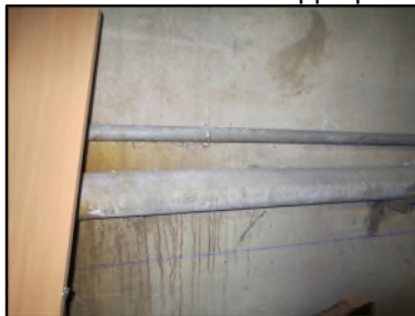
Photo N° 641 AMIANTE CIMENT - CAVE 6_S.sol Conduits de fluide Chute E.U.(Fibres-ciment)