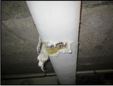
Photo N° 634 ECH-N°2 CALORIFUGEAGE --SOUS SOL Conduits de fluide Laine minérale + enveloppe plâtrée

Dossier n°: 2013-09-300 FK DTA PC_070LAB_OPH