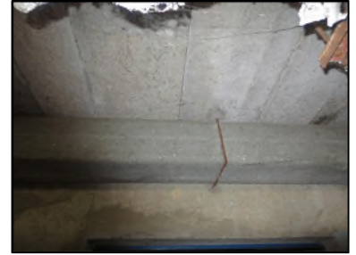
Photo N° 637 AMIANTE CIMENT -- COULOIR CAVE Conduits de fluide Ventilation haute (Fibres-ciment)